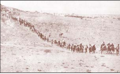
Ἐκτοπισμένοι Ἕλληνες τοῦ Πόντου πορεύονται στὴν ἔρημο τῆς Ἀνατολίας.

Ἡ Βουλὴ τῶν Ἑλλήνων ἀναγνώρισε τὴν Γενοκτονία καὶ τὶς σφαγὲς κατὰ τῶν Ποντίων. Ἡ ἀναγνώριση τῆς Γενοκτονίας τῶν Ποντίων ἔγινε τὴν 24η Φεβρουαρίου 1994 διὰ τοῦ Νόμου 2193/1994 (ΦΕΚ Α΄ 32).